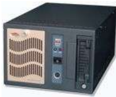
EasyLog BRS-5003 Multi-canal