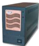
EasyLog BRS-800 Multi-Canal